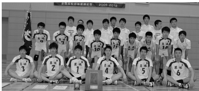
2013年3冠達成(翌年も3冠達成して2年連続となる)記念写真