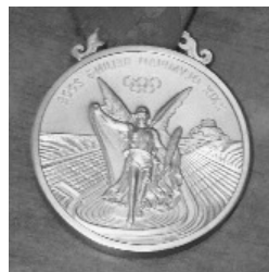
←馬淵選手の北京オリンピック金メダル