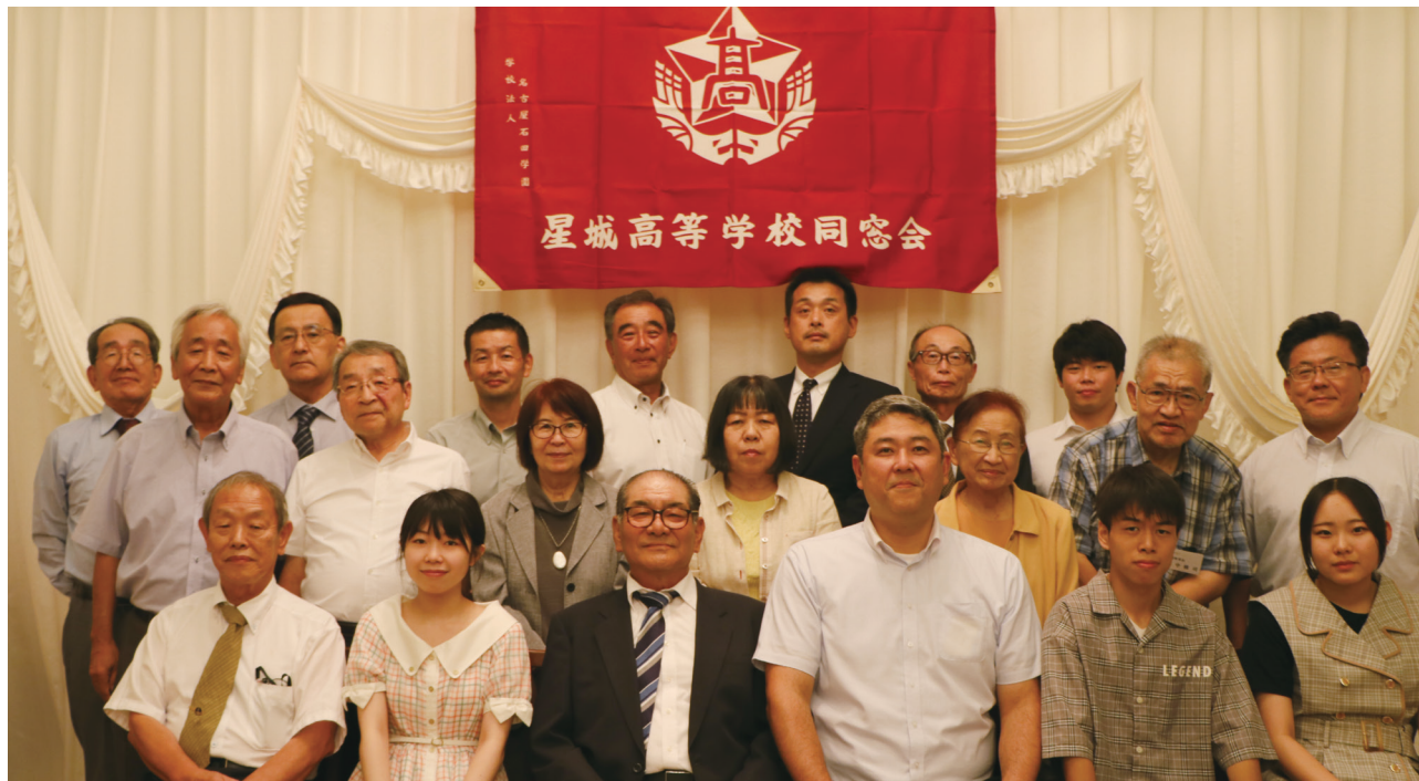
令和5年9月3日 総会兼幹事会

第55回星城高等学校同窓会総会を下記の要領で開催致します。学校の現況、また学校生活の思い出、四方山話など楽しいひとときをお過ごしいただけるものと信じております。皆様の御出席を、心からお待ち致しております。